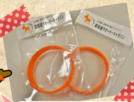
修了の証として講師からオレンジリングを頂いたよ！

① しおや保育所 ③ デイズニーシーが好きです。中でも、ダッフィーとシェリーメイがお気に入りです。グッズを集めています。今年もシーに行けるといいな・・・