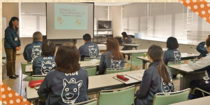
▲新たに31名の職員が認知症サポーターに